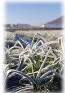
▲朝は霜で白くなっているにんにく畑。じっと寒さに耐えているよ。