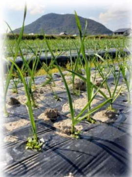
▲10月に植え付けをしたにんにくたち。こんなに大きく成長したよ！